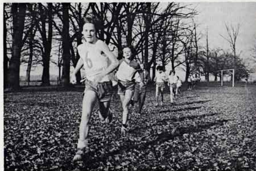
Einlauf ins Ziel