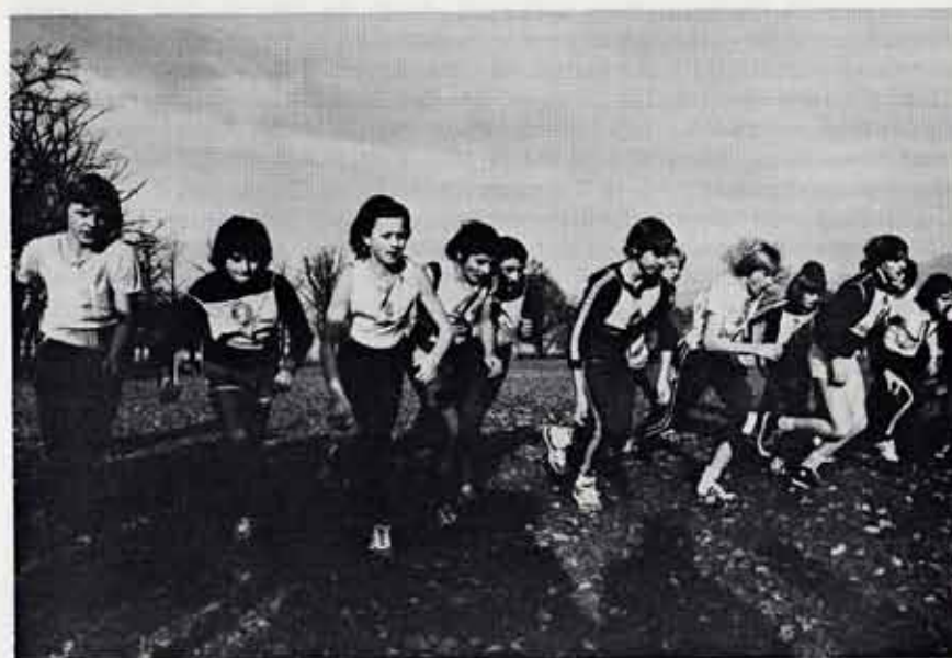
Start zum Rennen