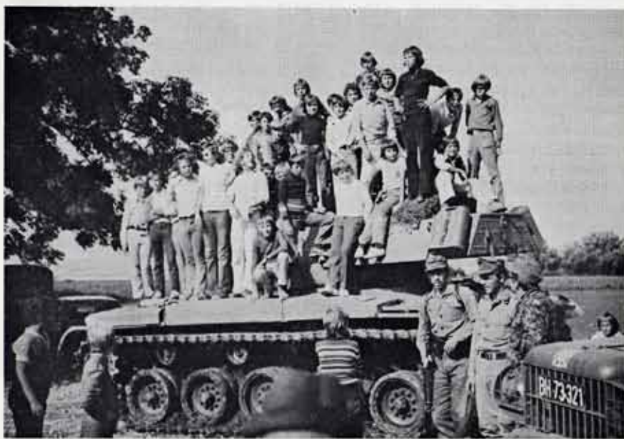
Unsere Jugend hat den Panzer erobert